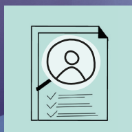
STRUMENTO DI AUTOVALUTAZIONE