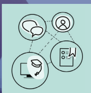
CORSO ONLINE APERTO SU LARGA SCALA