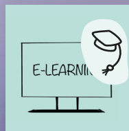
CORSO DI APPRENDIMENTO