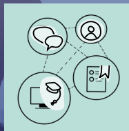
MOOC EIN OFFENER ONLINE-KURS