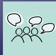
KONFERENZ ZUR PSYCHISCHEN GESUNDHEIT