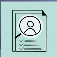
SELBSTEIN- SCHÄTZUNGS- TOOL